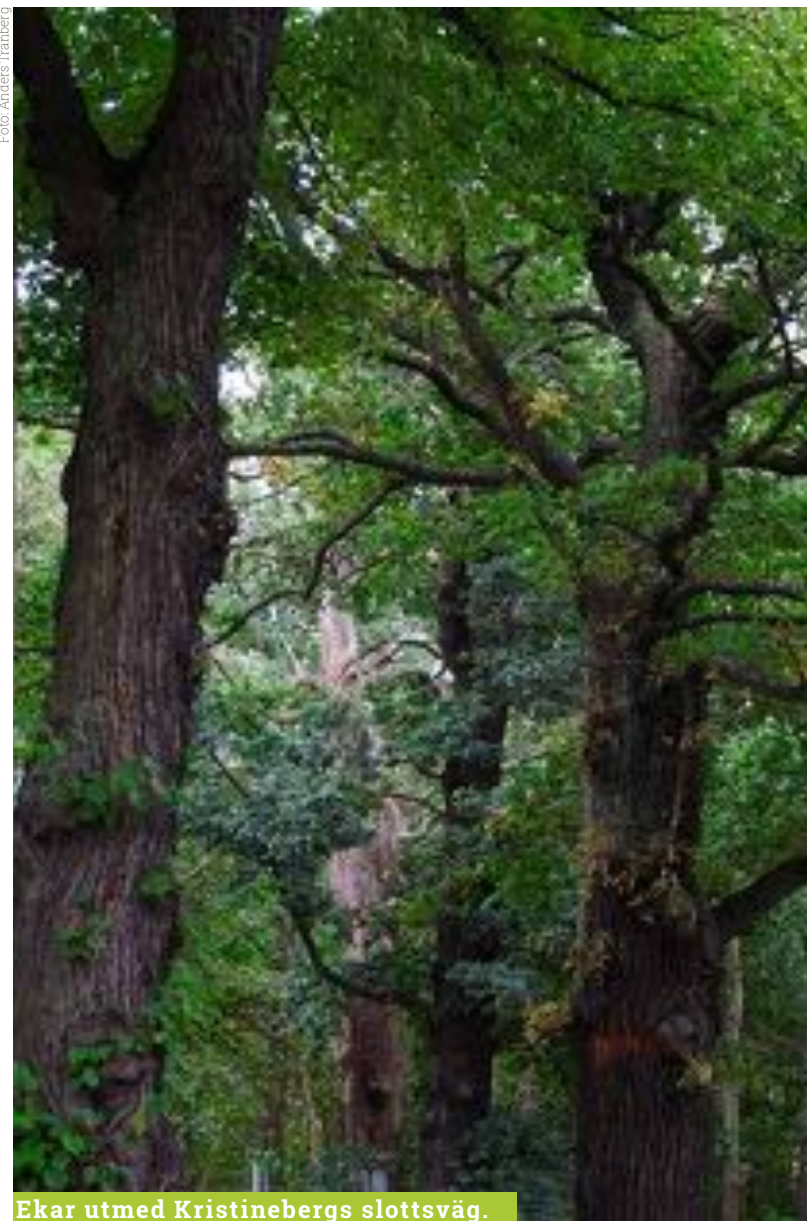
Ekar utmed Kristinebergs slottsväg.